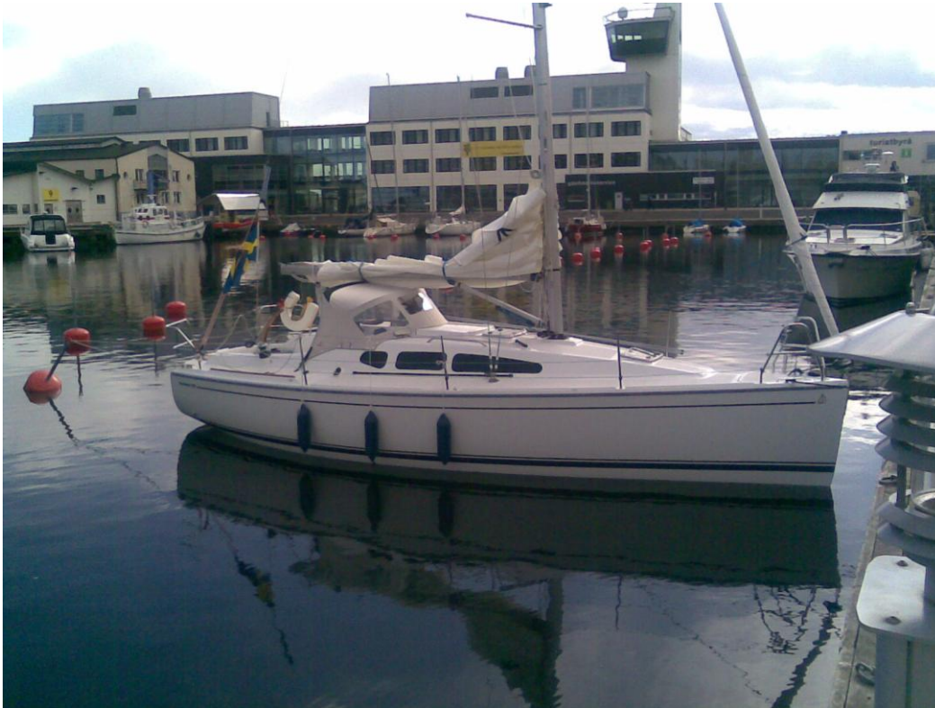
På plats i Kalmars gästhamn