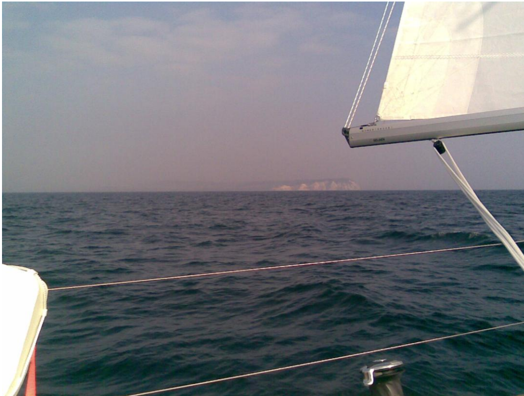
Passerar Møns Klint med sina vita klippor som når 143 meter över havet.

Efter påfyllning av diverse bränslen satte vi åter fart ut på vattnet kunde stundtals segla lite slör/läns innan det var dags att slå på motorn för stöttning igen. När vi väl passerat Ölands norra udde och mörkret hade etablerat sig upplevde vi några konstiga ljus på vattnet. Vi studerade sjökorten och diskuterade flitigt vad det kunde vara men det fanns inget som tydde på att det kunde vara ett hinder. Vi bestämde oss för att gå runt dessa ljus i fall det var fiskenät eller bogsering av något slag. Dessa ljus började då flytta sig vilket innebar att vi blev tvungna att styra oss ännu längre ut. När vi väl hade passerat ljusen vid ca: 02:30 på natten så slog de på ljusen på däck på några stora fartyg som låg där och lade ut kabel från Oskarshamns kärnkraftverk. Med facit i hand var det nog klokt att vi gick runt detta och inte rakt igenom, dock så förföljde dessa fartyg oss ett tag under natten men till slut kom vi undan.