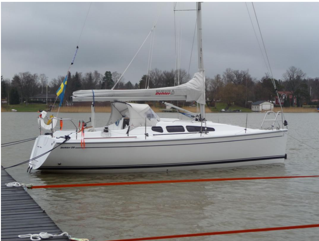
Båten vid sin plats i Väsbyviken

Nu är båten hemma och det har varit en härlig resa med lite för lite segling. Det är det bara att göra färdigt det som fattas och ge sig ut med en kanon fin båt i sommar.